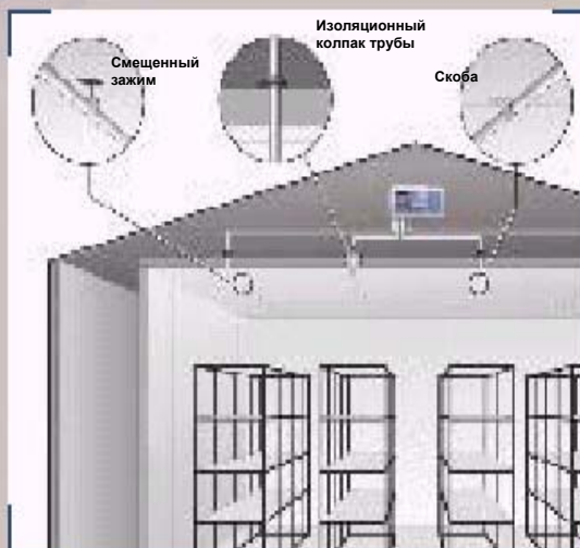
3 Схема склада-холодильника с системой труб для отбора проб воздуха

Как правило, здание склада-холодильника по своей конструкции мало отличается от обычного склада (см. рис. 3).