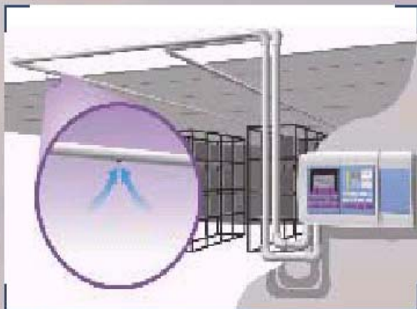
2 Система труб VESDA

Система труб VESDA охватывает площадь до 2000 м 2 (20 000 кв. футов) на один детектор; благодаря гибкой конструкции систему можно адаптировать к любой конфигурации склада-холодильника.